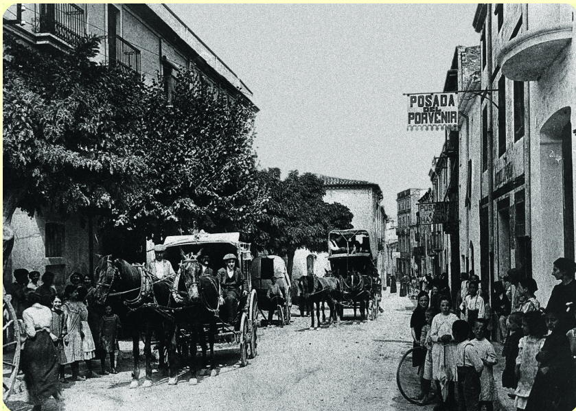
La prehistòria d'un repte: el carrer Sant Antoni lliure de contenidors, finals del s. XIX

La Timba es va tancar al segle XX durant la dècada dels 50, i quaranta anys després, a començaments dels anys 90, la situació havia canviat radicalment. Amb la multiplicació dels envasos com a element utilitzat a qualsevol tipus de producte, la recollida dels residus s'havia de gestionar d'altra manera. A Espanya no existia encara la cultura del reciclatge i tota la brossa es llençava barrejada. Va ser necessari, llavors, introduir els contenidors al carrer.