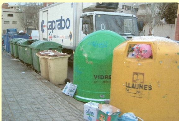
Punt de contenidors del carrer Montardit, any 2004

La situació començava a fer-se preocupant. El 2004, cada habitant de Sant Sadurní generava 1,60 kg de residus al dia, respecte als 0,8 kg que se'n feien només 10 anys enrere. Els carrers continuaven omplint-se de contenidors de rebuig , de vegades ocupant voreres senceres, i a això s'havia d'afegir els problemes d'olors que suposava tenir tanta brossa concentrada al carrer.