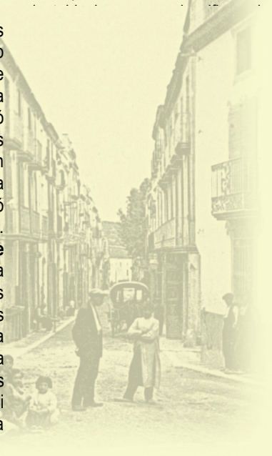
Fotografia del fons: carrer Montserrat. Principis del segle XX

També s'anaven buscant solucions als problemes dels residus al carrer. Amb l'aparició de les primeres plantes de reciclatge, el 1993 es va instaurar la recollida selectiva de vidre, el 1994 la de paper i cartró i el 1998, la d'envasos lleugers. Els contenidors verds, blaus i grocs es van sumar als de rebuig, però el problema continuava existint i els índex de recuperació de la brossa es mantenien molt baixos. Aprofitant la inauguració de la planta de compostatge de Vilafranca l'any 2000, a Sant Sadurn es va provar de fer un pas més i el 2001 es van afegir al carrer els contenidors de brossa orgànica. Es va experimentar una petita millora, pero encara resultava insuficient: la quantitat de residus dels domicilis augmentava any rere any, i majoritàriament es seguia llençant la brossa sense separar als contenidors de rebuig.