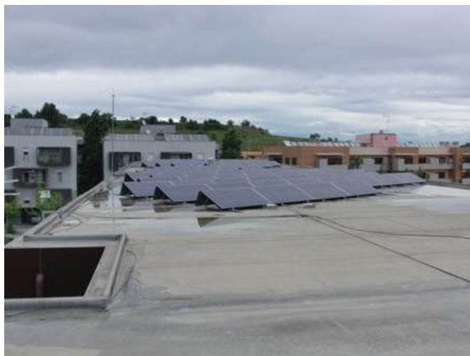
Fotos terrat de l'IES Sant Sadurní