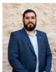
CARLES DEL AMOR: HISENDA I SERVEIS CENTRALS (SECRETARIA, OAC, FINESTRETA ÚNICA), MOBILITAT, MEDI AMBIENT I RECOLLIDA SELECTIVA