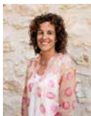
MERITXELL BORRÀS. 2A TINENT D'ALCALDE (SERVEIS A LES PERSONES): ACCIÓ SOCIAL I IGUALTAT, PROMOCIÓ ECONÒMICA, OCUPACIÓ I FORMACIÓ