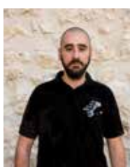
JORDI PUJOL REGIDOR CUP