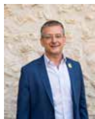
TON AMAT. 1R TINENT D'ALCALDE (SERVEIS CENTRALS I HISENDA): RECURSOS HUMANS, NOVES TECNOLOGIES, PROMOCIÓ TURÍSTICA I COMERÇ