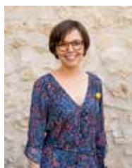
MARTA CASTELLVÍ. 5A TINENT D'ALCALDE (ÀMBIT EDUCATIU, CULTURAL I ESPORTIU): CULTURA, COOPERACIÓ I JOVENTUT