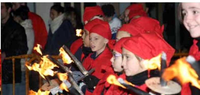
L'Ajuntament agraeix a tots els voluntaris i col·laboradors de la comissió de Reis la seva participació en la recollida de cartes i la Cavalcada dels Reis d'Orient.