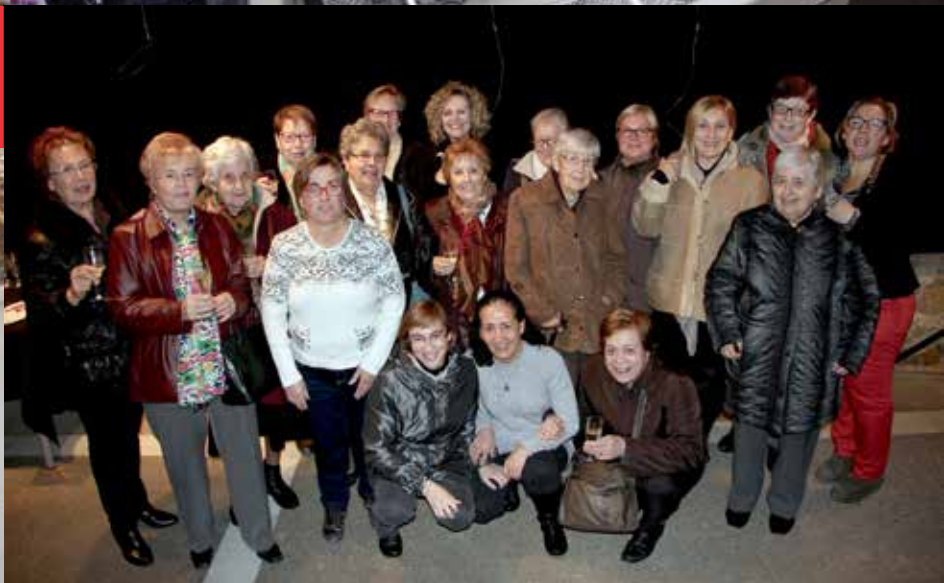
Les puntaires van mostrar un ampli ventall dels seus treballs a una exposició a l'Índex. La pista exterior de l'Ateneu va acollir una nova edició del certamen d'skate.