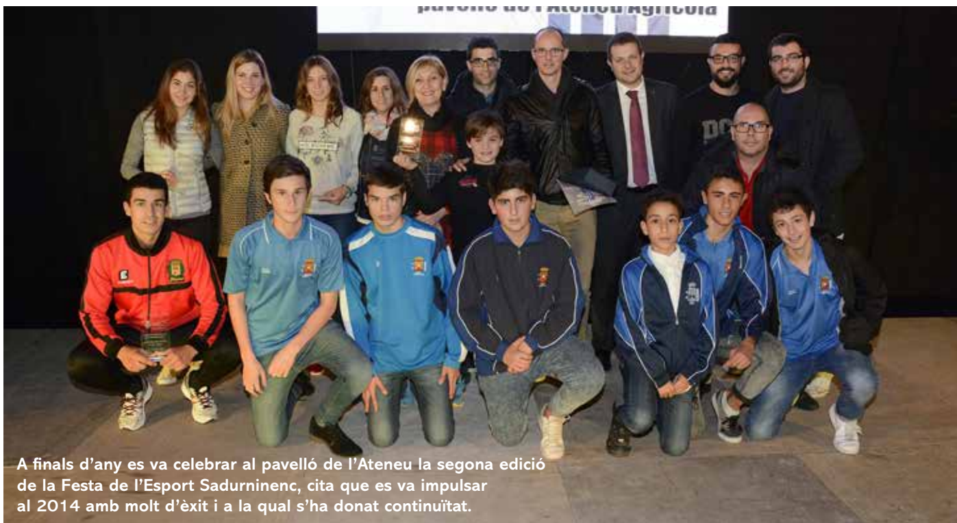
A finals d'any es va celebrar al pavelló de l'Ateneu la segona edició de la Festa de l'Esport Sadurninenc, cita que es va impulsar al 2014 amb molt d'èxit i a la qual s'ha donat continuïtat.