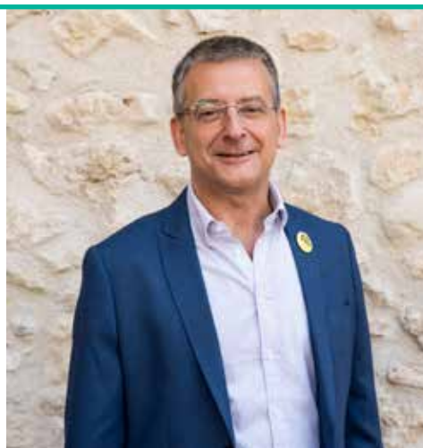
Ton Amat Alcalde de Sant Sadurní