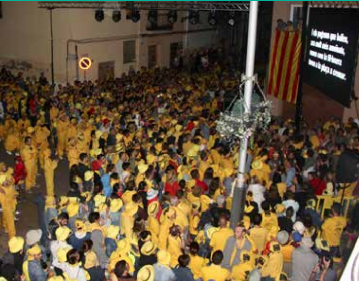
EL PREGÓ DE LES FIRES 2018 VA ANAR A CÀRREC DELS ALCALDES DE ZEGAMA I CAÑETE LA REAL, MUNICIPIS AGERMANATS AMB SANT SADURNÍ, I ES VA CLOURE AMB LA INTERPRETACIÓ DE DIVERSOS BALLS I MANIFESTACIONS CULTURALS DE CADA REGIÓ